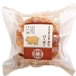
ミニメンチかつバーガー 176円(税込価格)(本体価格160円)