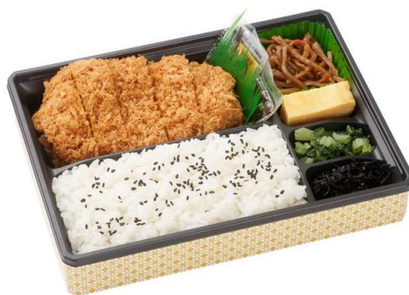
ローズかつ弁当 913円(税込価格)(本体価格830円)