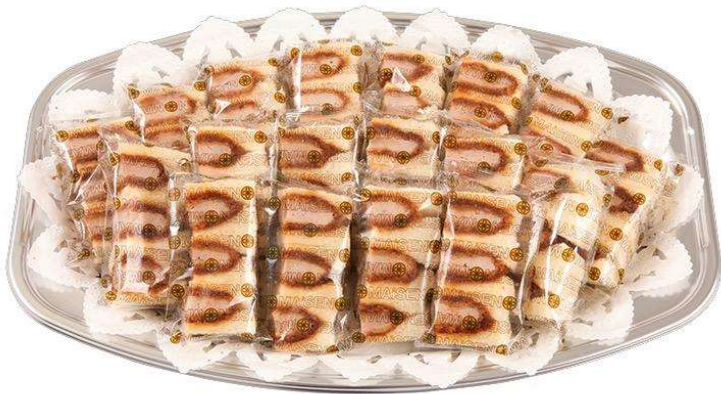
ヒレかつサンドオードブル ハーフカットサンド18切 4,180円(税込価格)(本体価格3,800円)