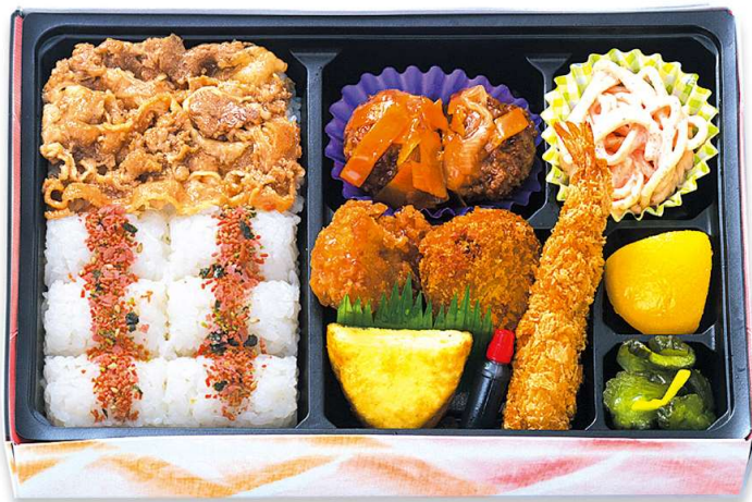
肉めしフライ弁当