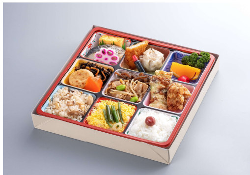
花御膳 1,305円(税込価格) (本体価格1,186円)