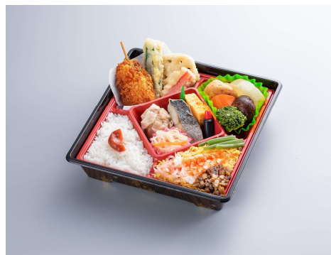
四季彩 1,155円(税込価格) (本体価格1,050円)