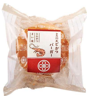
ミニエビかつバーガー 264円(税込価格)(本体価格240円)