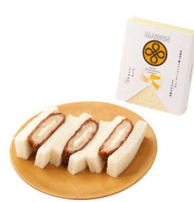
チーズメンチかつサンド 3切 462円(税込価格)(本体価格420円)