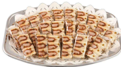
ヒレかつサンドオードブル ハーフカットサンド22切 5,115円(税込価格)(本体価格4,650円)