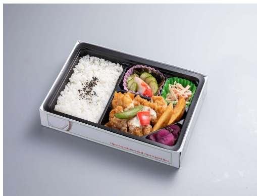
チキン南蛮弁当 1,100円(税込価格) (本体価格1,000円)