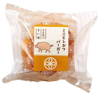
ミニヒレかつバーガー 253円(税込価格)(本体価格230円)