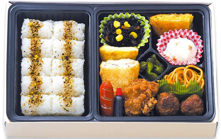
洋風バラエティ弁当