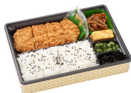
ヒレかつ弁当 957円(税込価格)(本体価格870円)