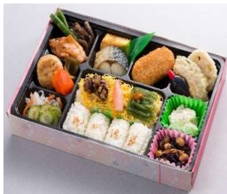
姫ごろも 1,172円(税込価格) (本体価格1,065円)