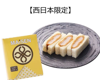
【西日本限定】 ヒレかつサンドハニーマスタード 3切 462円(税込価格)(本体価格420円)