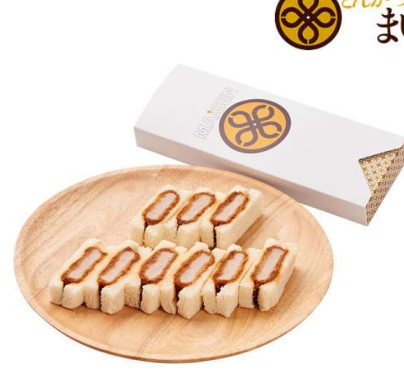
ヒレかつサンド 9切 1,331円(税込価格)(本体価格1,210円)