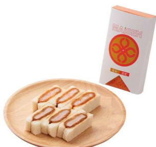
ミックスサンド(ヒレ・エビ) 各3切 941円(税込価格)(本体価格855円)