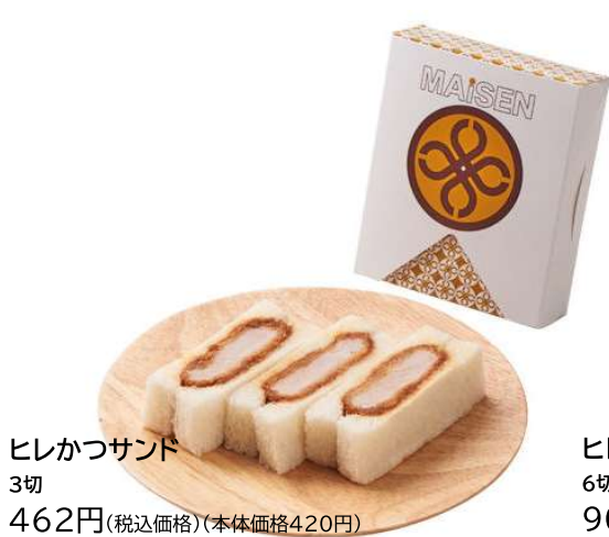
ヒレかつサンド 3切 462円(税込価格)(本体価格420円)