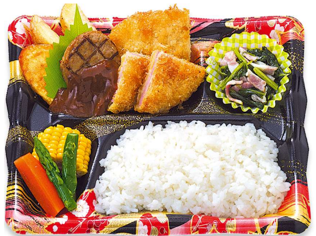
ハンバーグミックスDX