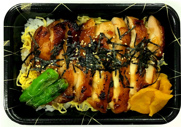
鶏の照焼重(汁物付)