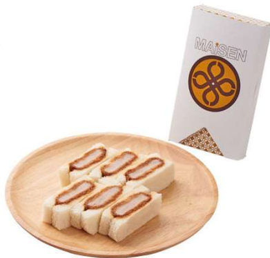
ヒレかつサンド 6切 908円(税込価格)(本体価格825円)