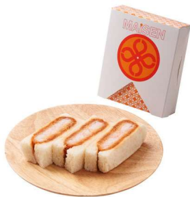
エビかつサンド 3切 495円(税込価格)(本体価格450円)