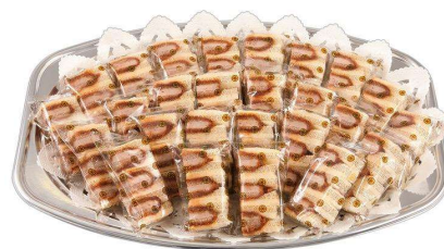
ヒレかつサンドオードブル ハーフカットサンド26切 6,050円(税込価格)(本体価格5,500円)