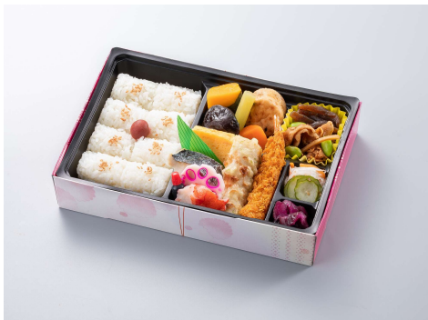
幕の内瀬戸 1,100円(税込価格) (本体価格1,000円)