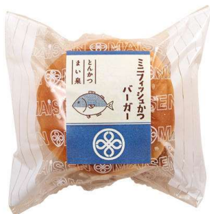
ミニフィッシュかつバーガー 231円(税込価格)(本体価格210円)