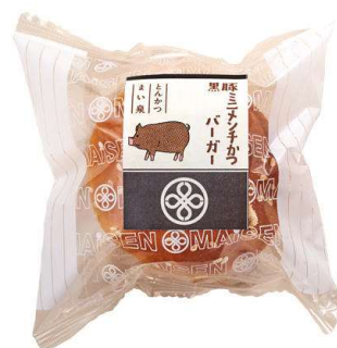
黒豚ミニメンチかつバーガー 209円(税込価格)(本体価格190円)