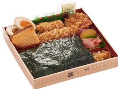
ごちそう海苔弁当 1,155円(税込価格) (本体価格1050円)

□写真はイメージです。 ■配膳が必要な場合はサービス料(飲食の10%)を頂戴致します。 □食材の仕入れ状況などによりメニュー内容が変更の可能性があります。 ※お客様の安全を最優先に考え、食物アレルギー対応は行っていません。ご了承願います。 ■ご用命は実施日の1週間前まで(土・日・祝を除く)・数量の変更は同3日前まで(土・日・祝を除く) □「とんかつまい泉」ページの商品 1種類につき3食以上・合計10食以上から承ります ■ヒレかつサンドオードブルにつきましては1皿から承ります □「とんかつまい泉」ページの商品 納品時間は10:00以降でのお届けとなります