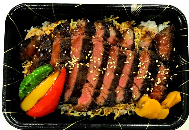
ステーキ重(汁物付)