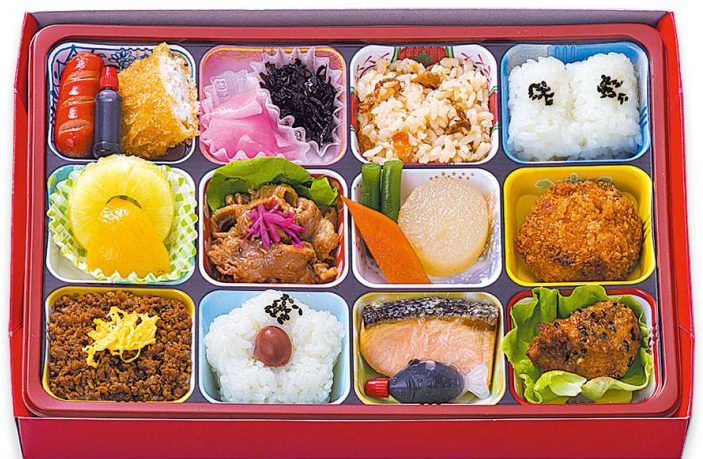
洋風ゴージャス弁当