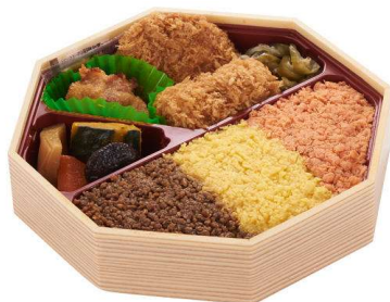
いろどり弁当 1,078円(税込価格) (本体価格980円)