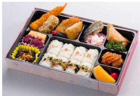
かすみ草 1,100円(税込価格) (本体価格1,000円)

※お客様の安全を最優先に考え、 食物アレルギー対応は行っておりません。ご了承ください。