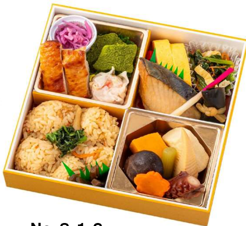
No. 8 1 2 松花堂弁当