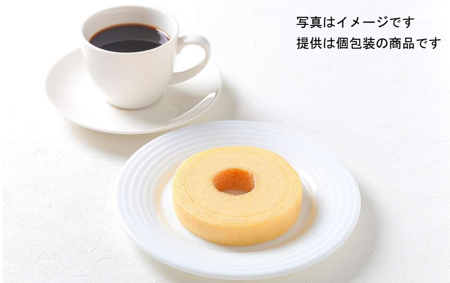
写真はイメージです 提供は個包装の商品です

「燦」「響」「近畿大学水産研究所」など多彩なスタイルのレストランを東西に展開するサントリーの外食グループの会社です。 ナレッジキャピタル7階「ナレッジサロン」よりお届けさせていただきます。