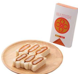
ミックスサンド(ヒレ・エビ)