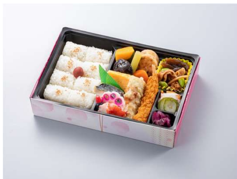
幕の内瀬戸 1,223円(税込価格) (本体価格1,112円)