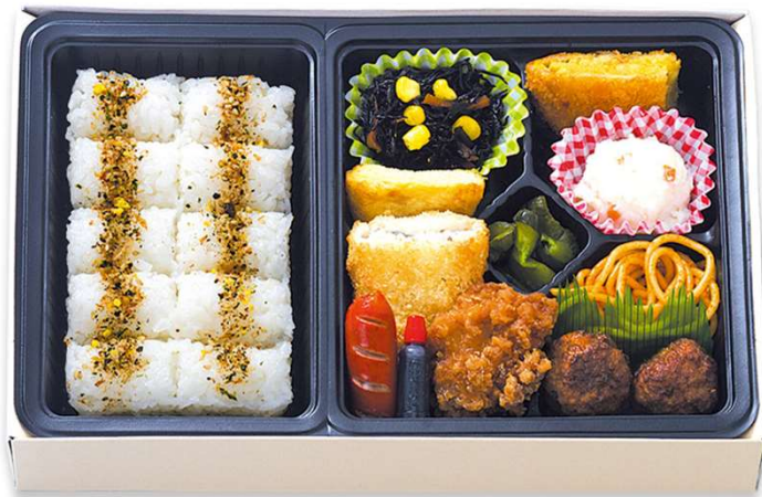
洋風バラエティ弁当