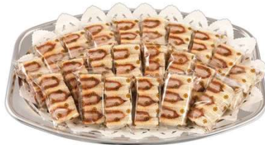
ヒレかつサンドオードブル ハーフカットサンド22切 5,610円(税込価格) (本体価格5,100円)