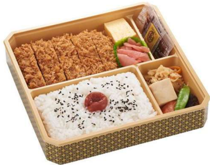
やわらかヒレかつ弁当