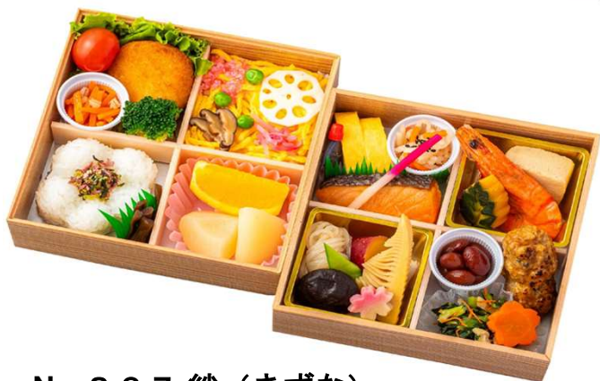
No. 8 0 7 絆 (きずな)