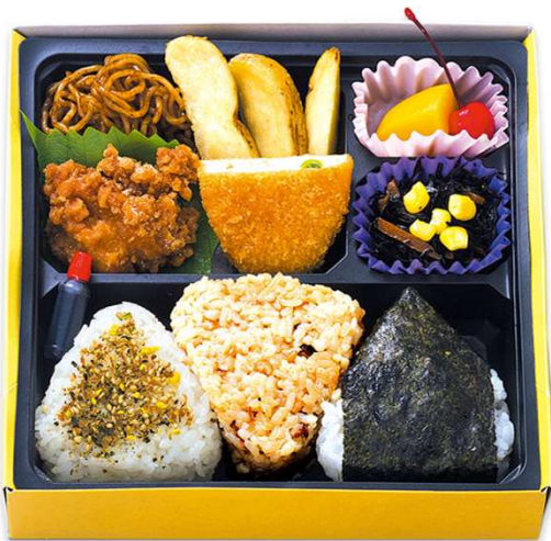
三色おにぎり弁当