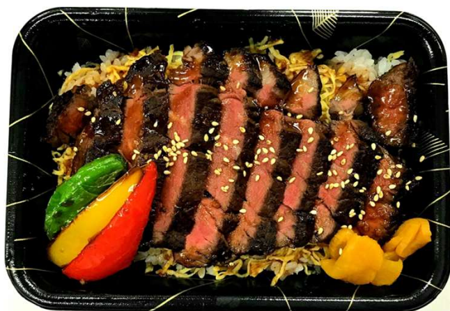
ステーキ重（汁物付）