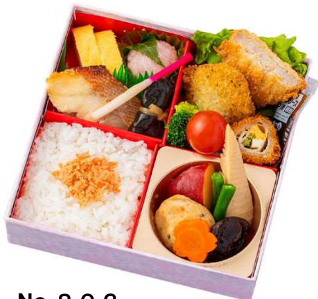
No. 8 0 3 花かぐら