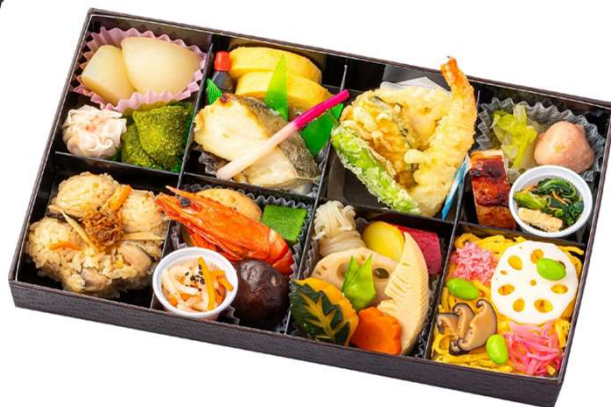
No. 8 0 6 雅 (みやび)