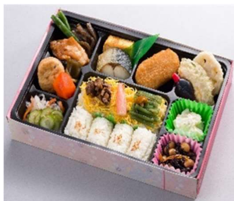
姫ごろも 1,324円(税込価格) (本体価格1,204円)