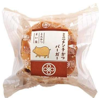
ミニメンチかつバーガー 187円(税込価格) (本体価格170円)