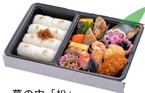
幕の内「松」 1,650円(税込価格) (本体価格1,500円)