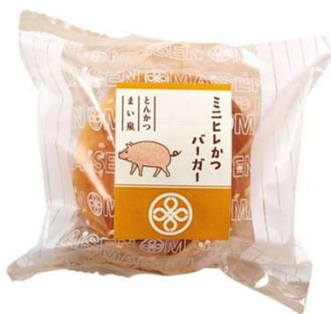
ミニヒレかつバーガー 264円(税込価格) (本体価格240円)