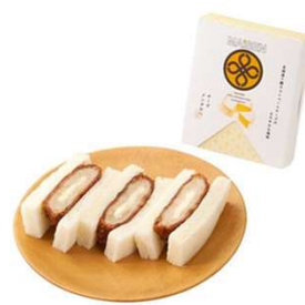
チーズメンチかつサンド