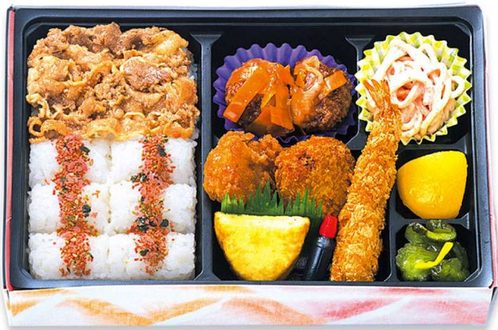
肉めしフライ弁当