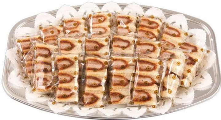
ヒレかつサンドオードブル ハーフカットサンド18切 4,620円(税込価格) (本体価格4,200円)