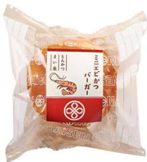
ミニエビかつバーガー 275円(税込価格) (本体価格250円)