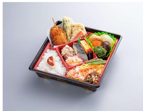
四季彩 1,386円(税込価格) (本体価格1,260円)