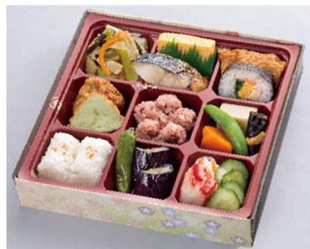
味小町 1,386円(税込価格) (本体価格1,260円)