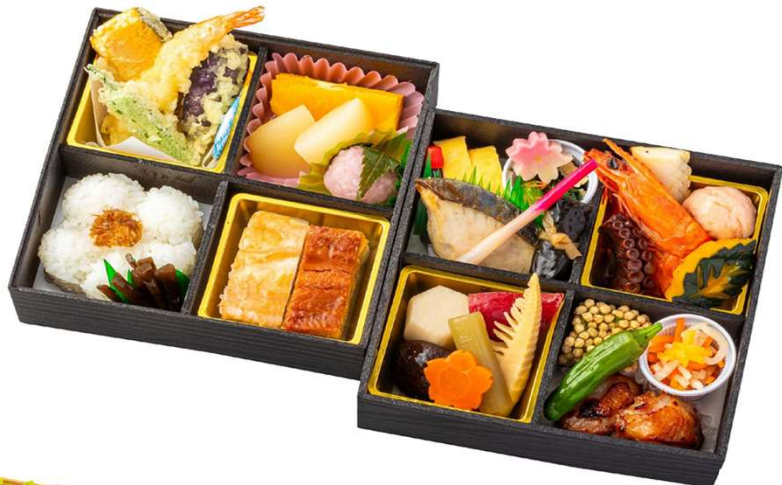
No. 8 0 5 舞 (まい)