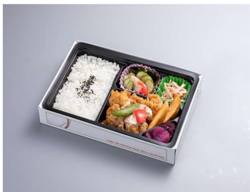
チキン南蛮弁当 1,274円(税込価格) (本体価格1,158円)