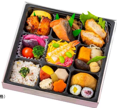
No. 8 0 2 花こもん