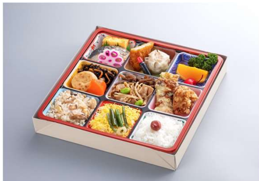
花御膳 1,477円(税込価格) (本体価格1,343円)