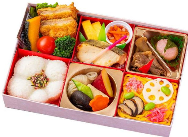
No. 8 1 0 花かすり