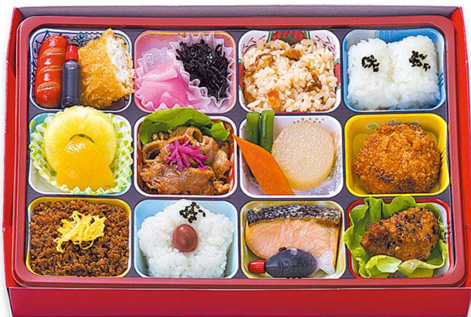
洋風ゴージャス弁当