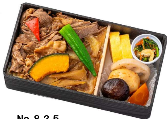
No. 8 2 5 淡路牛の牛めし弁当