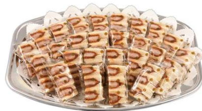
ヒレかつサンドオードブル ハーフカットサンド26切 6,545円(税込価格) (本体価格5,950円)