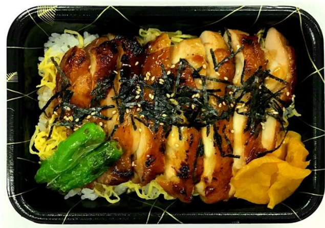
鶏の照焼重（汁物付）