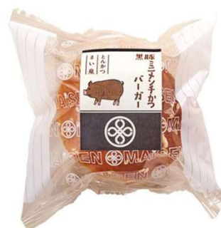
黒豚ミニメンチかつバーガー 220円(税込価格) (本体価格200円)