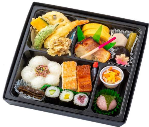
No. 8 1 1 上幕の内弁当

「燦」「響」「近畿大学水産研究所」など多彩なスタイルのレストランを東西に展開するサントリーの外食グループの会社です。 ナレッジキャピタル7階「ナレッジサロン」よりお届けさせていただきます。