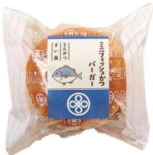
ミニフィッシュかつバーガー 238円(税込価格) (本体価格220円)