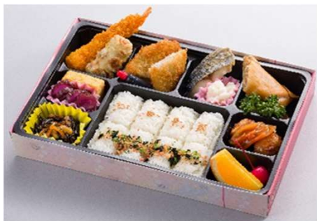
かすみ草 1,324円(税込価格) (本体価格1,204円)

※お客様の安全を最優先に考え、 食物アレルギー対応は行っておりません。ご了承願います。