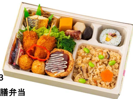
No. 8 1 3 なにわ御膳弁当